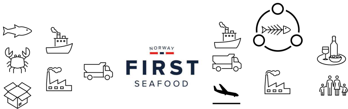
Figur 1. Skjematisk oversikt over verdikjeden